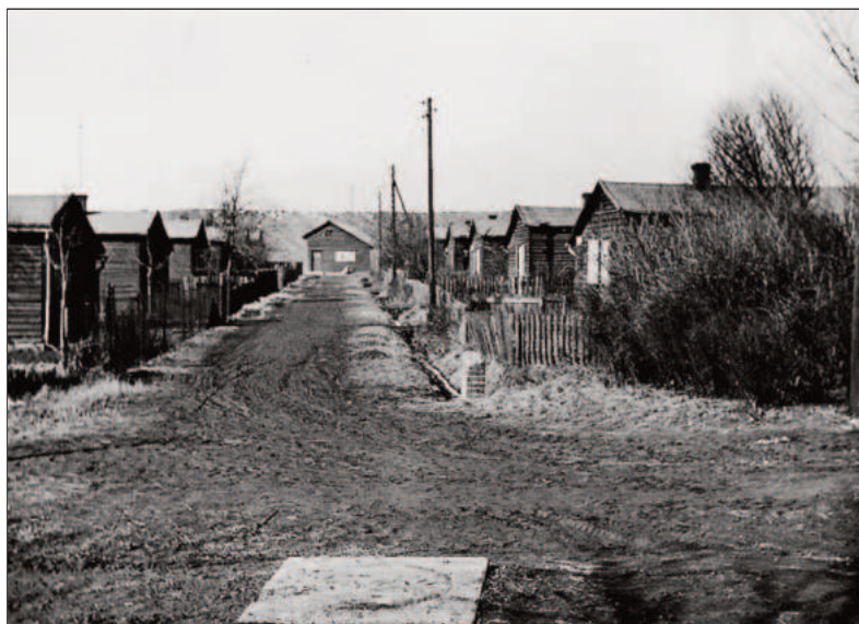
Beuthen Wertherweg 1937