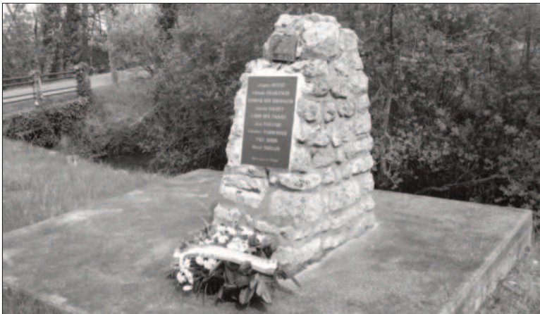
Obelisk der erschossenen Franzosen »Mort pour La France«

In der Nähe des ehemaligen Nachbarsperrpunkt 8 stießen wir zufällig am Straßenrand auf einen Obelisk, der etwa zwei Meter groß, aus edlem Material gefertigt und am Fuß geschmückt mit einem Kunst-Blumenstrauß war. In goldenen Lettern waren darauf die Namen von acht Männern verzeich-