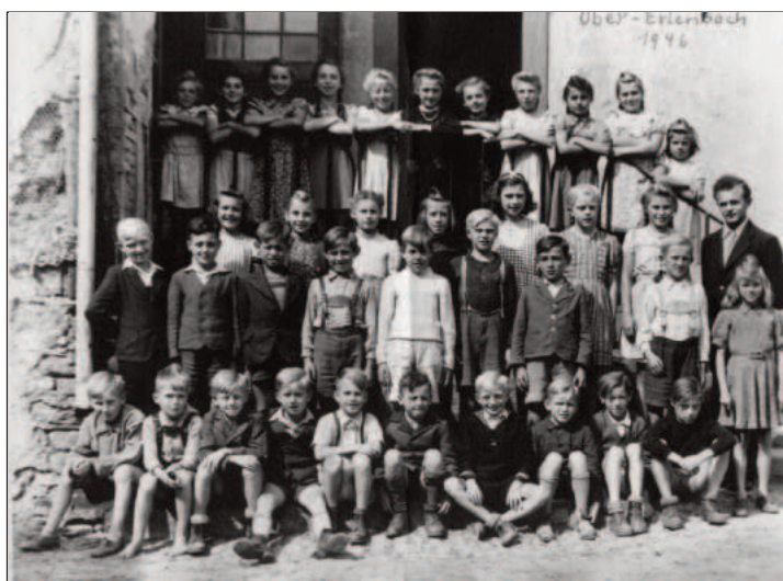
Lehrer in Ober-Erlenbach 1946