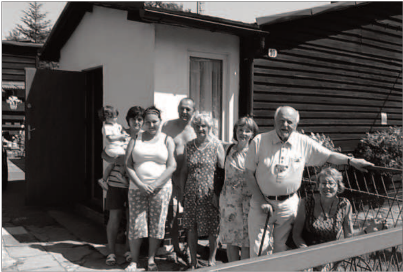
Bytom Józefa Bema, ehemaliger Wertherweg 2013

guten Zustand zu versetzen. Ihr Bestreben ist es, es zu erhalten und nicht verfallen zu lassen.