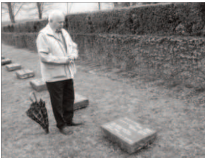
Auf dem Soldatenfriedhof Berneuil