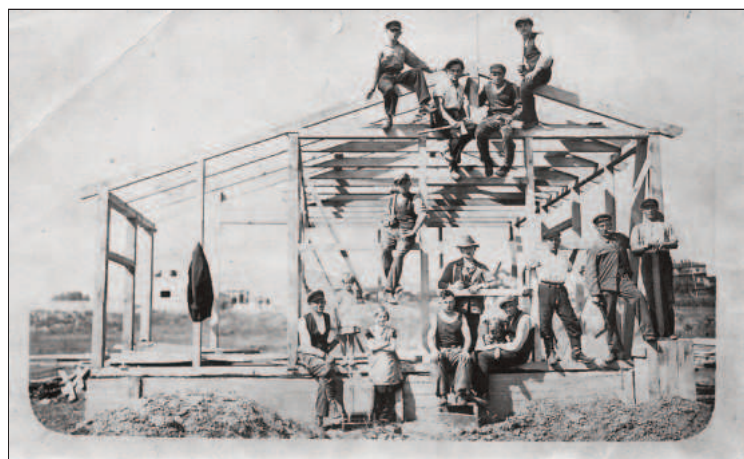
Bau des Hauses Wertherweg 10 1934