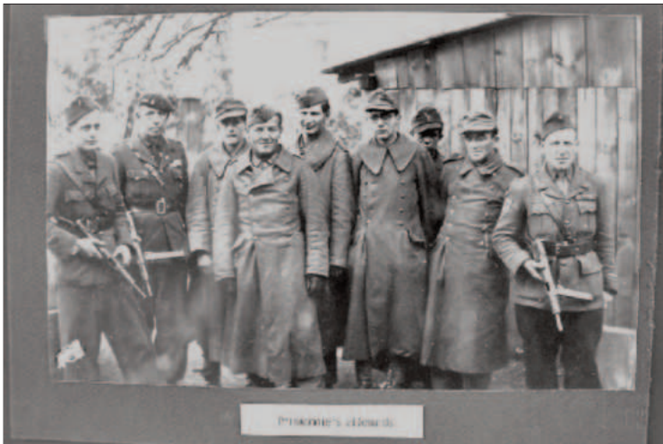
Deutsche Kriegsgefangene der Festung Gironde Süd

Frankreich wollte zum Schluss des Krieges einen Sieg über das verhasste Nazi-Deutschland, und die Deutschen wollen noch einmal in einer ehrenvollen Niederlage deutsches Heldentum dokumentieren. Nur aus diesem psychologischen Blickwinkel lässt sich diese tragische Entwicklung erklären. Der Ablauf ist in dem erwähnten Buch »Die letzten Bastionen« schnell erzählt. Unser Seebataillon Narvik, bestehend aus den Überlebenden des Zerstörers 24 und des Torpedoboots 24, wurde nach den Luftangriffen auf die Schwerpunkte in der Festung zurückgezogen. Sie gruben sich an der Nordspitze von Pointe de Grave ein, errichteten Maschinengewehrstellungen, verstärkt mit leichten Abwehrgeschützen und vielen Schützenlöchern. Die Franzosen eröffneten den Angriff in einem stundenlangem Bombardement nach amerikani-