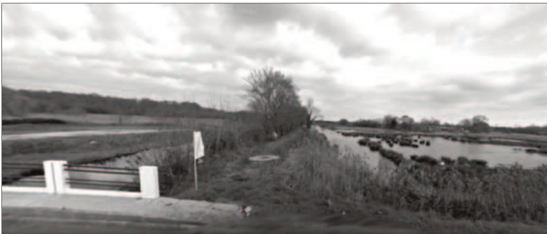
Damm zwischen den beiden Kanälen, an dem wir unseren Wachposten hatten. Die Brücke und Straße im Vordergrund wurde erst nach dem Krieg gebaut.

Gironde Süd, unsere Festung mit dem Hauptort Soulac, in Friedenszeiten ein beehrter Badeort, war im Großen und Ganzen eine Tiefebene von 300 Quadratkilometern. Der übliche mediterrane Winterregen hatte große Teile der Gesamtfläche unter Wasser gesetzt, wo nur Straßen, eine Bahnlinie, einige kleine Ortschaften und nur wenige Landesteile aus dem Wasser herausragten. Mitten durch das Land lief ein Kanal, den wir Ventsac nannten. Die Besonderheit dieses Kanals bestand darin, dass er parallel an einem erhöhten Damm entlang lief. Dieser Damm war teilweise die Grenze unseres Befestigungsareals – die Grenze zum »Feindesland«. Das Hinterland mit den Ortschaften St. Vivien, Soulac, Le Verdon, Lesparre, Montalivet und der Spitze Point de Grave musste durch deutsche Soldaten geschützt werden. Eine größere An-