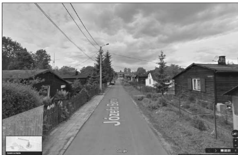
Bytom, Józefa Bema 2012, ehemaliger Wertherweg