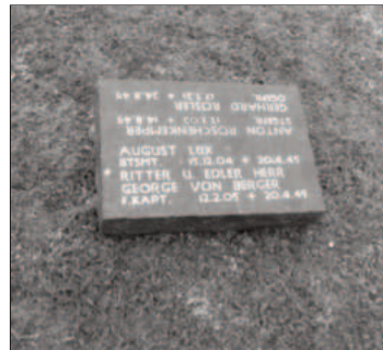
Grab des Fregattenkapitäns von Berger