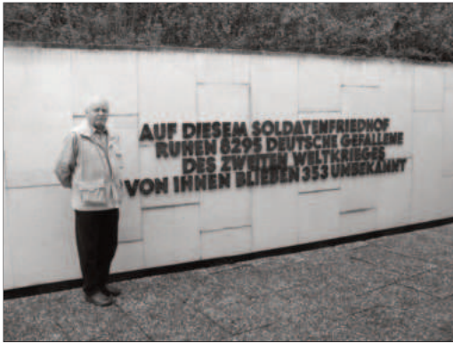
Soldatenfriedhof Berneuil: Hier ruhen die Gefallenen der Festung Gironde Süd

Menschen durch diesen Umstand ihr Leben verloren, wird mich jeden Tag für den Rest meines Lebens bedrücken.