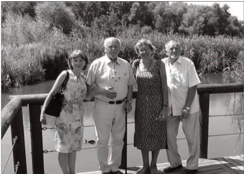
Bytom Park Mickiewicza 2013, ehemaliger Goethepark